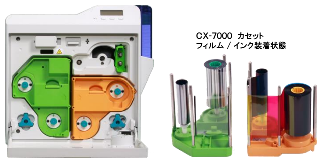
CX-7000 カセットフィルム / インク装着状態